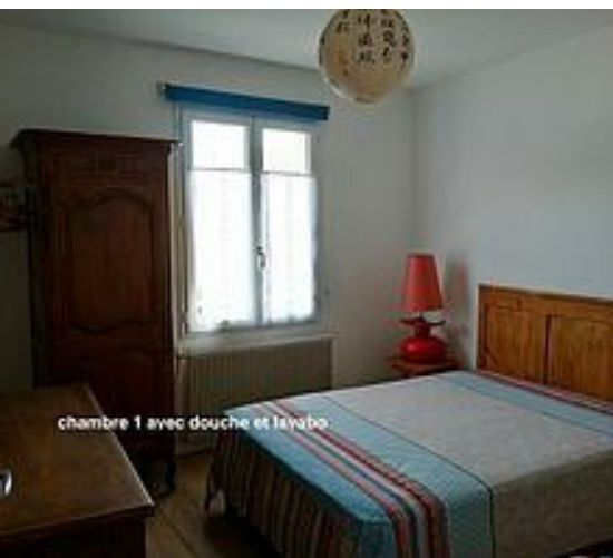
chambre 1 avec douche et lavabo