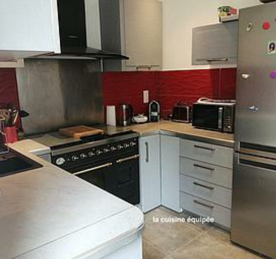
la cuisine équipée