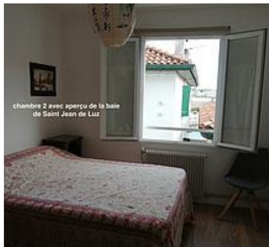
chambre 2 avec aperçu de la baie de Saint Jean de Luz