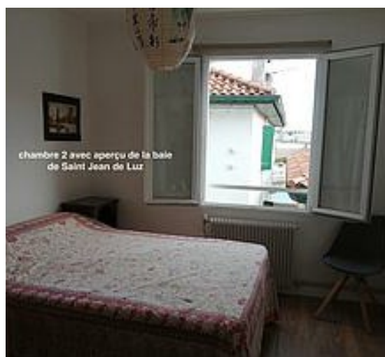
chambre 2 avec aperçu de la baie de Saint Jean de Luz